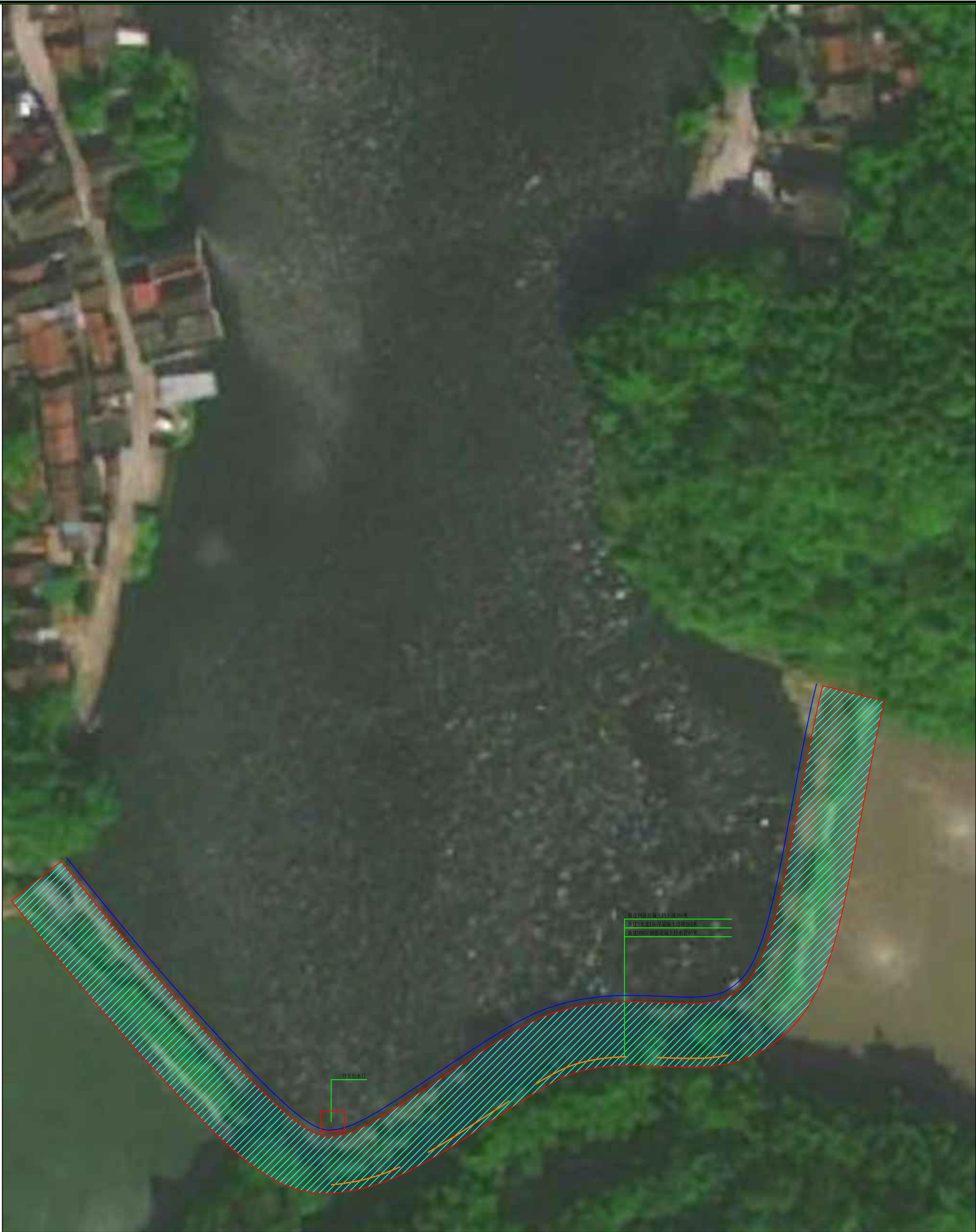
挡土墙、道路、排水管位置图 1:100