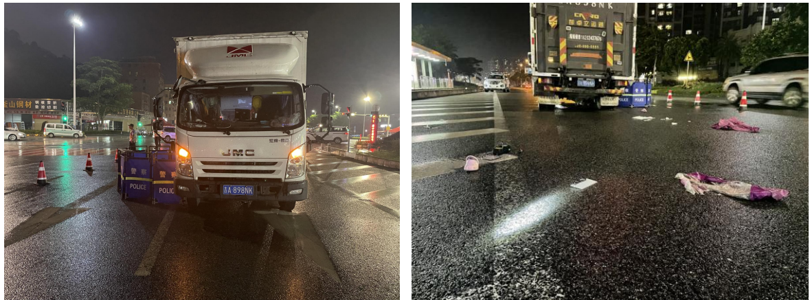
图一 吉 A898NK 号牌轻型厢式货车事故现场照片