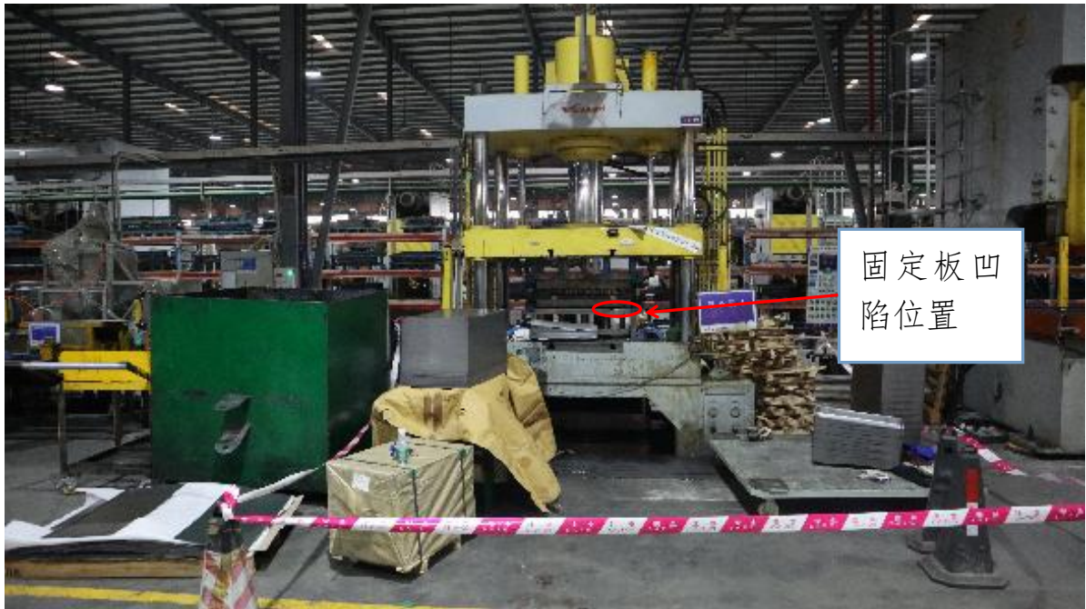
图一 事故现场情况