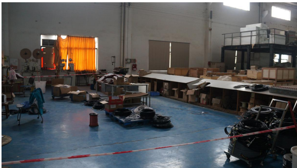
图二 广东讯达电梯有限公司 B 车间地面情况