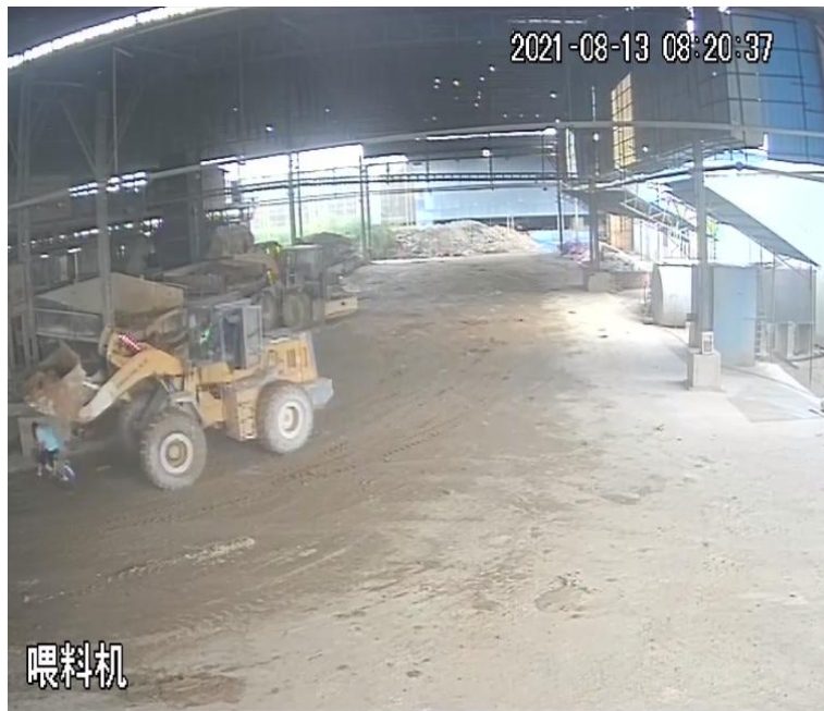
图二 事故现场监控录像