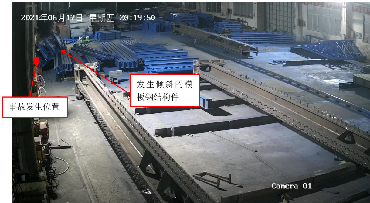
图二 事故现场监控录像