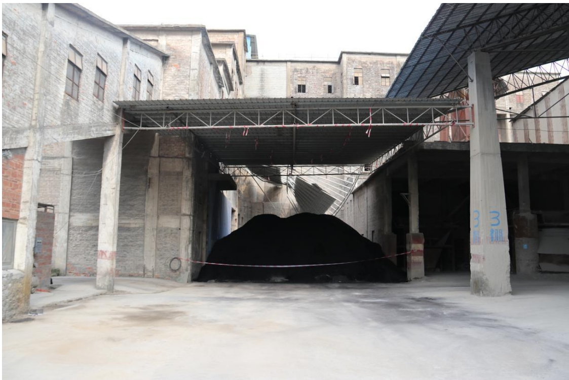
图三 原材料仓库现场情况