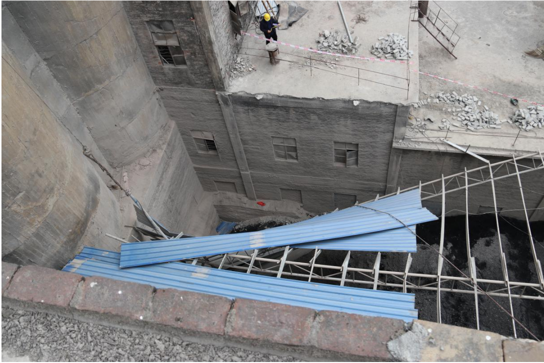
图四 原材料仓库挡雨棚坍塌情况